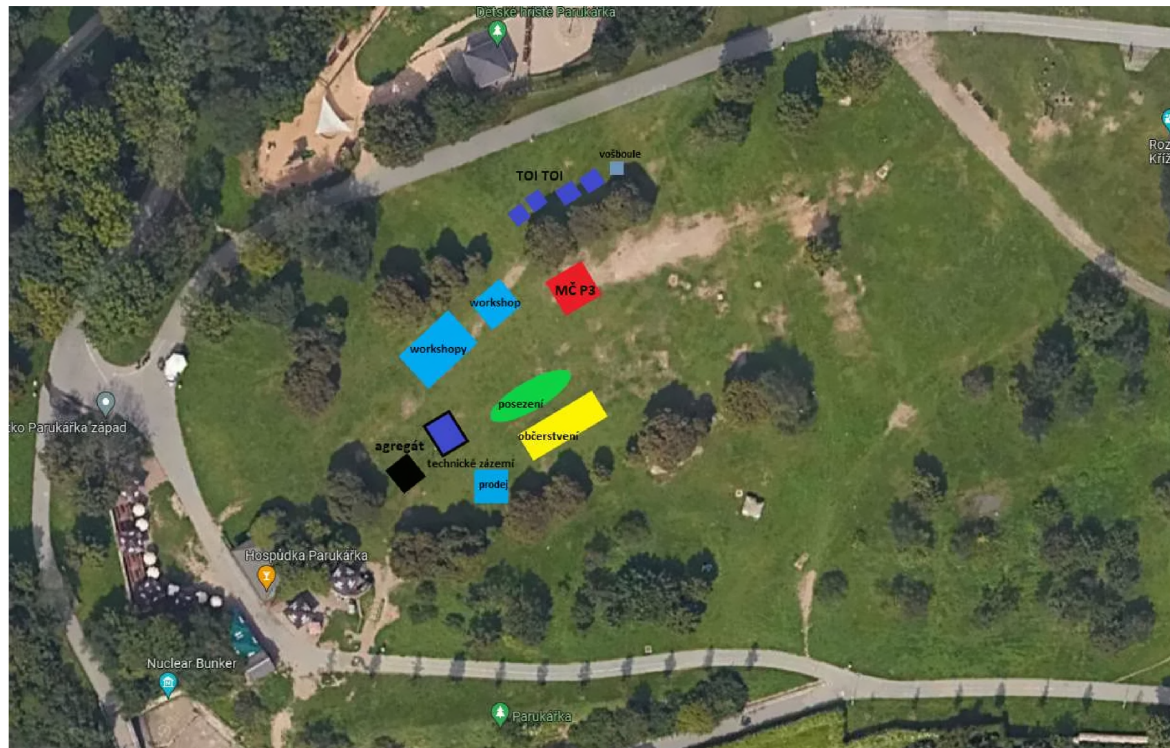
Příloha č. 2 – situační plánec se zakreslením umístění všech zařízení